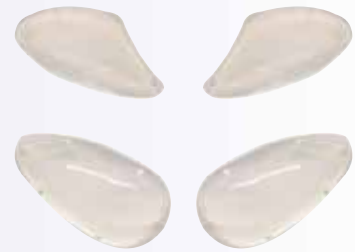
Implantes de malar