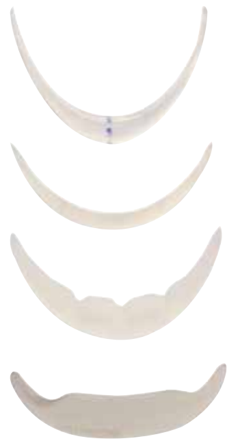
Implantes de mentón

Una selección de implantes dorsal nasal, de malar y de mentón para dar forma a un individuo contorno facial estético