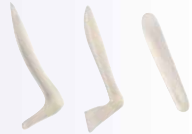
Implantes dorsal nasal