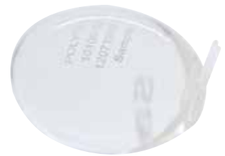
Con guía de aguja

Implants made by POLYTECH – Quality made in Germany