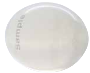
Con casquete reforzado

Implantes rellenos de gel de silicona o de elastómero de silicona suave, con casquete reforzada o guía de aguja, disponibles en cinco tamaños